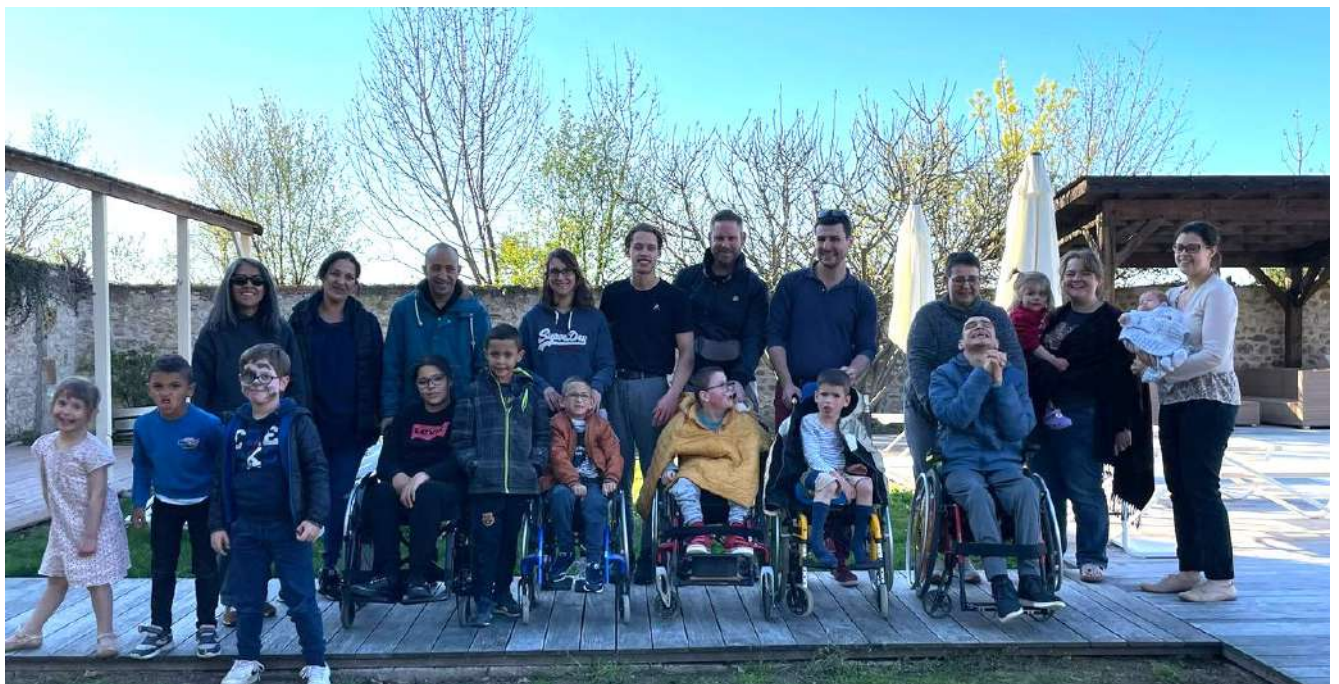
Ci dessus : Les familles de la semaine 1 Ci-dessous : les familles de la semaine 2